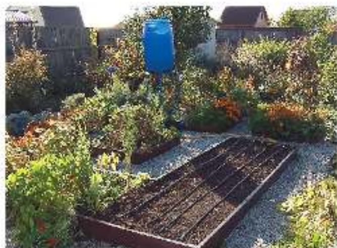
Пример расположения системы капельного полива для упорядоченных посадок на садовом участке.